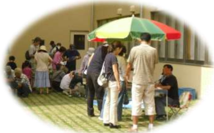
平成29年無料頒布会の様子（富士見小学校において）

「いきいきボランティア養成講座」で、ボランティア活動の様子を紹介して下さった団体の中から、毎月ピックアップして掲載しています