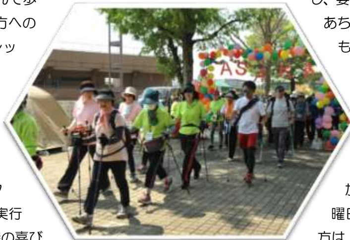
昨年の「健康増進フェスタ」スタート風景

「NORDICあさか」の強みは、何よりノルディック・ウォークの運動効果が早期に実感出来ることにありますが、やはり運営スタッフが共通の価値観を確認しながら計画から実行までのプロセスを共有することで、達成した時の喜びや楽しみも共有していることです。