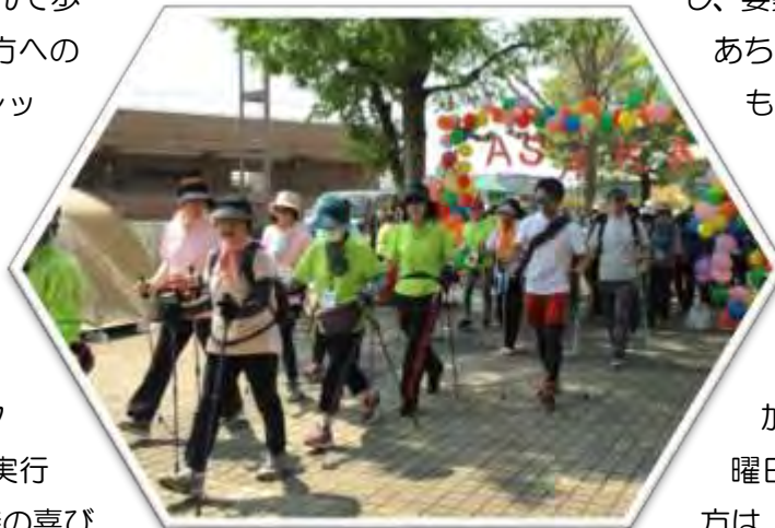
昨年の「健康増進フェスタ」スタート風景

「NORDICあさか」の強みは、何よりノルディック・ウォークの運動効果が早期に実感出来ることにありますが、やはり運営スタッフが共通の価値観を確認しながら計画から実行までのプロセスを共有することで、達成した時の喜びや楽しみも共有していることです。