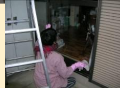
電球交換、窓ふき掃除をするボランティア